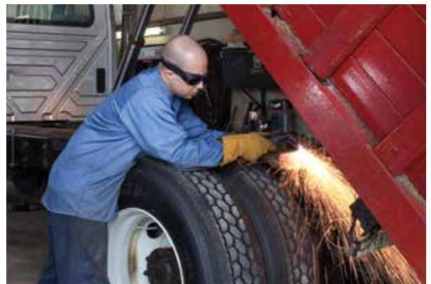
Fahrzeugreparatur und -umbau