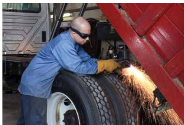
Réparation et modification de véhicules